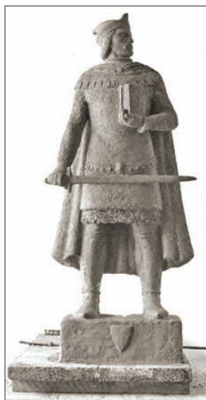
Drugeth János (szobor-terv, gipsz, 1942, fénykép a hagyatékból)

A szobor mértéktartó, négyszögletes talapzatának homlokzati oldalán, egy fekete márványtáblán a következő felirat volt olvasható: