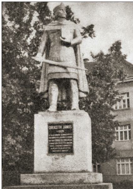
Drugeth János alumínium szobra Ungváron.

Sajnos alig mosta le az öntési hamut az eső, pár hét elteltével az ungvári Drugeth-szobron szörnyű elváltozások jelentek meg. A Kárpáti Híradó már 1943. augusztus 12-i számában Baj van az ungvári Drugeth-szoborral című cikkében jelezte, hogy „A háborús anyagból sikertelen öntési, illetve forrasztási következmények miatt leszerelik és javításba veszik a szobrot az öntődébe. [...] A szoboralak egyik részén a fémöntvény már átszakadt, másutt repedéseket mutat. [...] A szobrot tudvalevőleg az Országos Művészeti Tanács bírálata és hozzájárulása alapján készítették a szobrászművésszel és öntették az egyik budapesti öntőműhelyben. A kész szoboröntvény is kiállotta a szakértői bírálatot, mielőtt helyére került, a Drugeth-téri talapzatra.