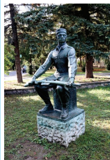
Ülő katona (szobor, bronz, 1970, Tapolca, Dobó tér)