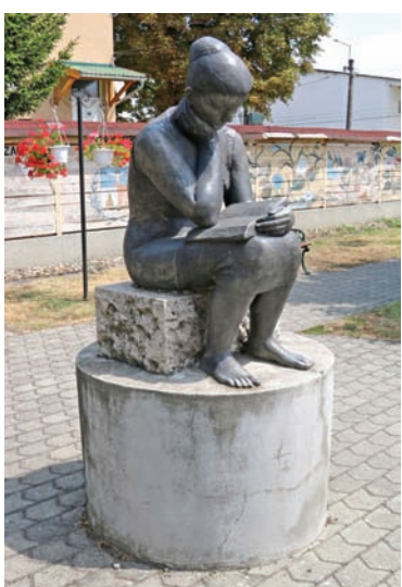
Ülő nő (alumínium, 1967, Seregélyes, Fő utca)