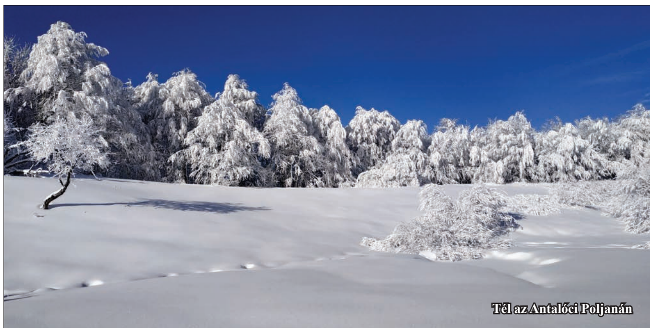
Tél az Antalóci Poljanán