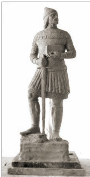
Drugeth János (szobor-terv, gipsz, 1942, sorsa ismeretlen, fénykép a hagyatékból)