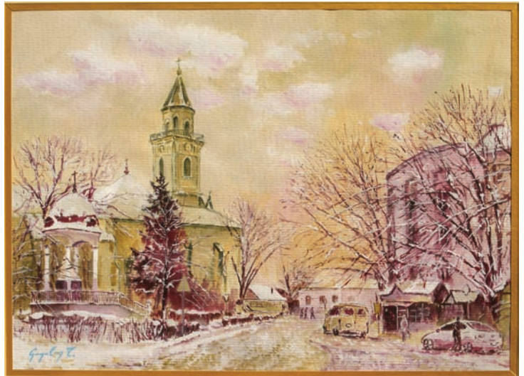
Gogola Zoltán festménye