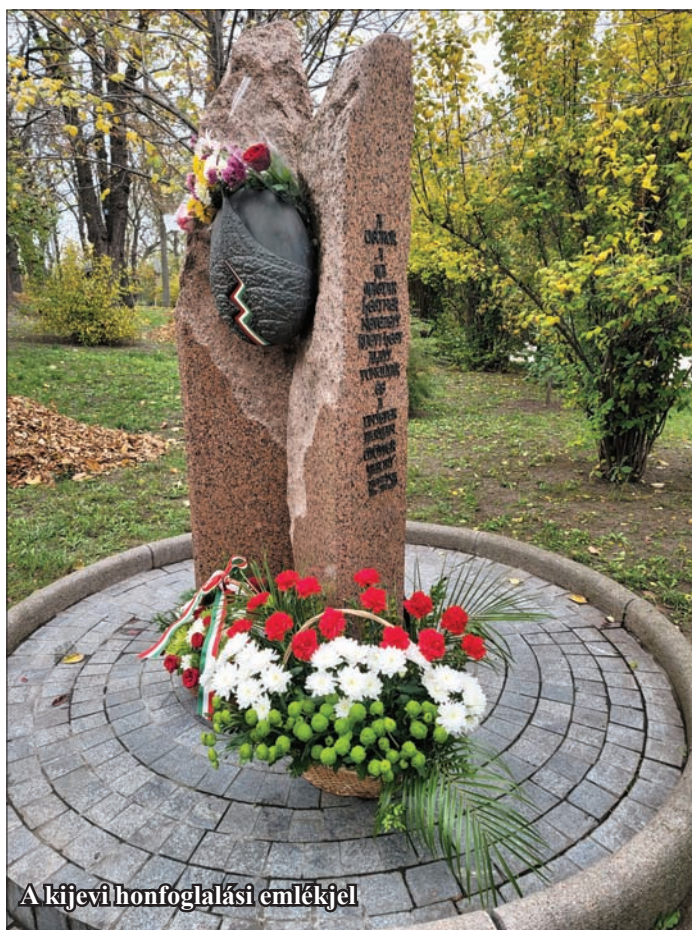
A kijevi honfoglalási emlékjel

– ... kívül és belül: poklosan örvényült, háborult világ, de a remény sohasem meghaló, ha minden utolsó szalmaszál ABBÓL A JÁSZOLBÓL VALÓ!