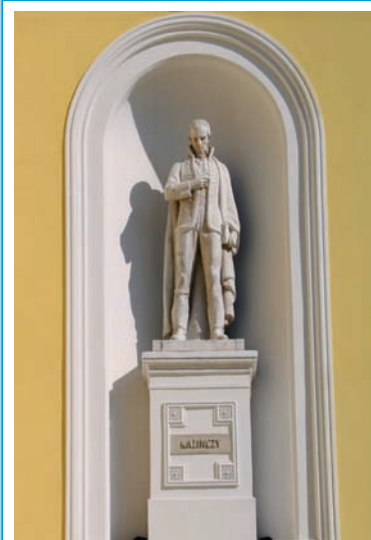
Kazinczy Ferenc (fülkeszobor, kő, 1960, Debrecen, Csokonai Színház)