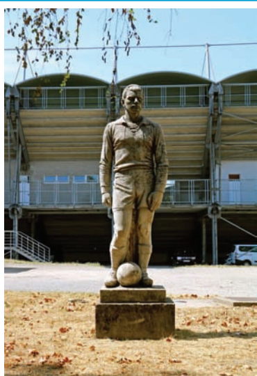
Labdarúgó (kő, 1967, Dunaújváros, Eszperantó út, sporttelep)