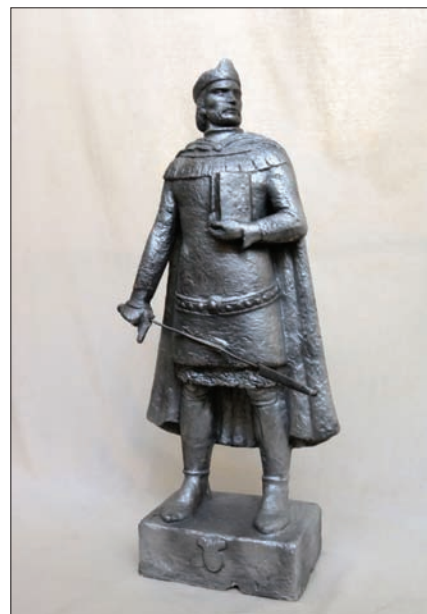
Drugeth János (szobor-terv, gipsz, 66×28×14 cm, 1942, a hagyatékból)

A Drugeth-szobor elkészítését a kultusz-minisztérium 4000 pengővel támogatta, és így a városnak már csak a hiányzó 3000 pengőt kellett előteremnie. A szobrot az Országos Képzőművészeti Tanács az ungvári várban tervezte felállítani. A