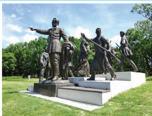
A Kossuth-szobor 6 mellékalkakja (bronz, 1952, Budapest, az Orczy-kert, a szoboralakok átrendezve, a kompozíció teljesen átalakítva)