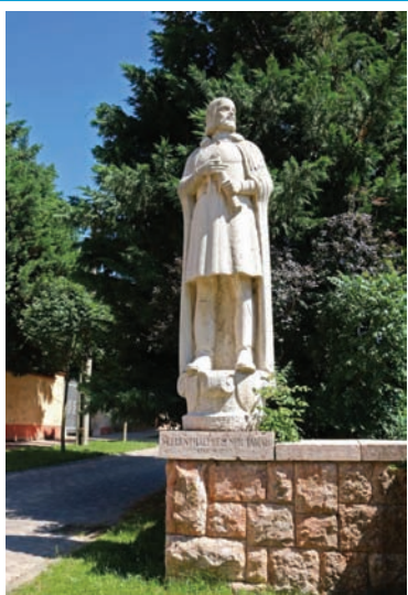
Fellner Jakab (kő, 1940, Tata, Kossuth tér)