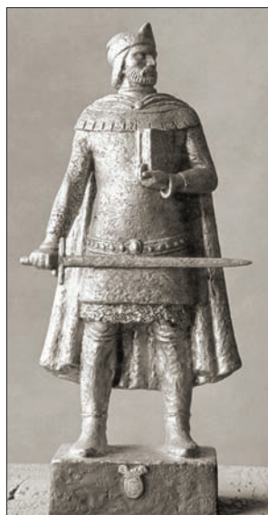
Drugeth János (szobor-terv, gipsz, 1942, fénykép a hagyatékból)