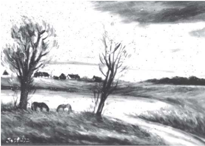
SOLTÉSZ PÉTER: Lovak