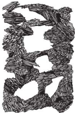
KOSZTÁK ISTVÁN GRAFIKÁJA

de az idő sátrán túl felragyog a reménytelenség