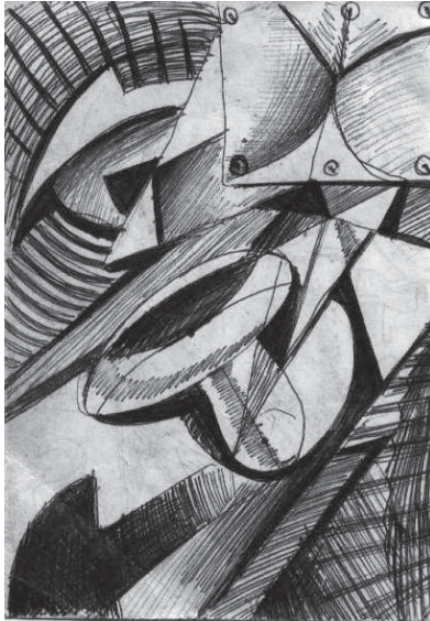
BECSKE JÓZSEF LAJOS: Semmi

Korbáccsal járom a lábadozó kertet: búzzatok el, árnyak, sok ordas látomás! De rám veti szemét, ki földrészeket renget, s a magnéziumfényben elfog a sírás.