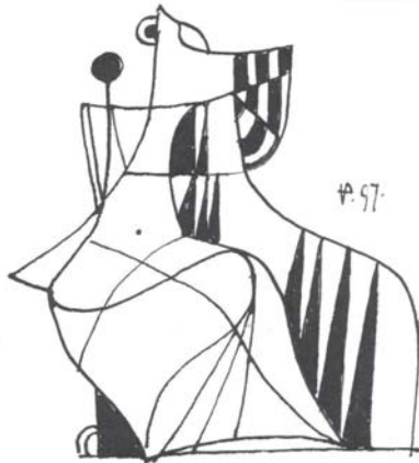
VERES PÉTER GRAFIKÁJA

Gyönyörű bűnt hagytam rátok, a lázadást, mely több mint Dózsa György; mit bánom, ha több az áruló, de lázadót is teremjen e föld!