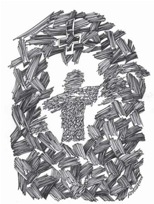
KOSZTÁK ISTVÁN grafikája

A szikra, mit felkapott a szél, szintén halott – sötétben csillagod: fájdalom vagyok.