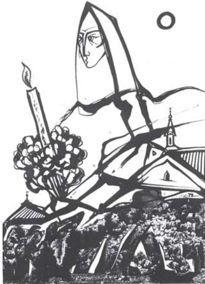
TÓTH LAJOS: Ima

A mélyülő éjszaka hallgat, beborítja a kertet, a lelket sötét takaróval.