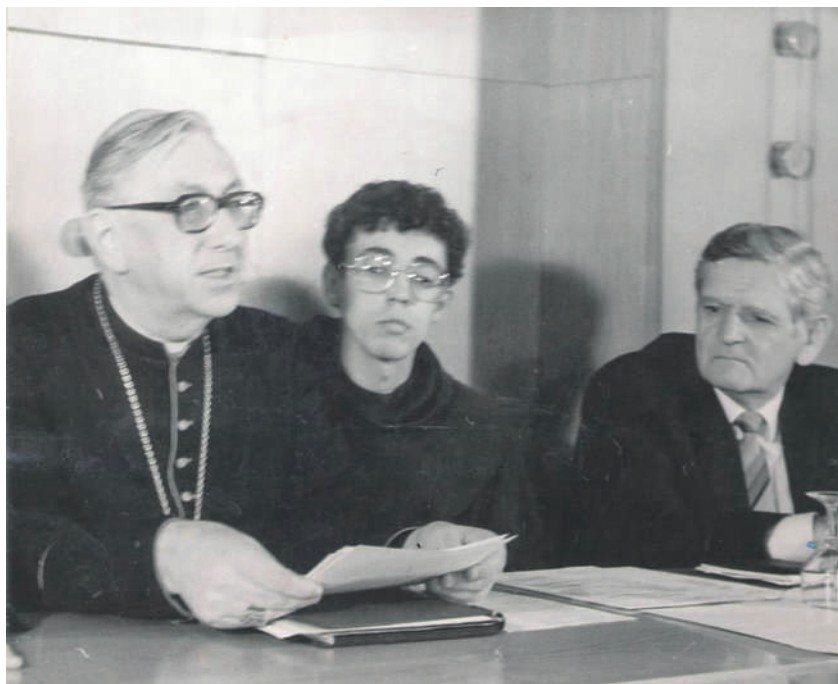
Dr. Paskai László bíboros kárpátaljai látogatása, 1989

Az egyház újraéledését az 1989 tavaszán Kárpátaljára látogató Dr. Paskai László bíboros, esztergomi érsek indította el. Látogatása és tárgyalásai eredményeként öt magyarországi pap kezdhetette meg Kárpátalján a szolgálatot a Szovjetunió megszűnésének éveiben.