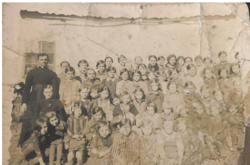
Görögkatolikus és római katolikus hittanosok 1936-ban

A Szent Ilona római katolikus templom kegyura: „a királyi nagyméltóságú pénzügyi minisztérium”.