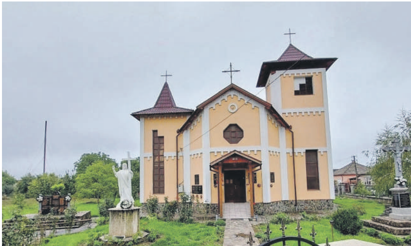
Az Tiszabökényi Árpád-házi Szent Erzsébet Római Katolikus Templom