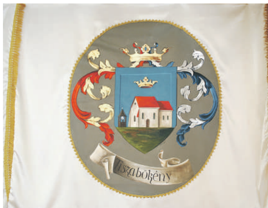
Tiszabökény zászlaja Molnár Zsolt (Zsámbok) alkotása

Tiszabökény zászlaja. Világos krém színű, sárga bojtos sáv körbe szegélyezi. A mezőben látható Tiszabökény címere.