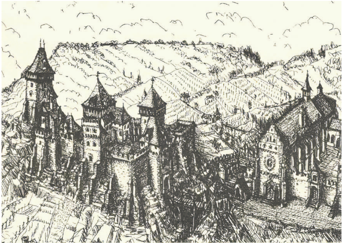
A Kankó-vár korabeli ábrázolása