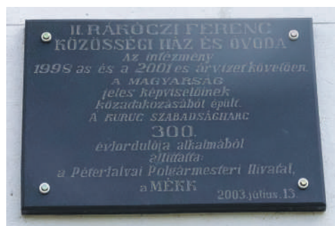
Emléktábla a kuruc szabadságharc 300. évfordulójára

Cím: Tiszabökényi Bölcsőde-Óvoda . 90354, Tiszabökény , Móricz Zsigmond u. 10. E-mail: bobovednz@gmail.com