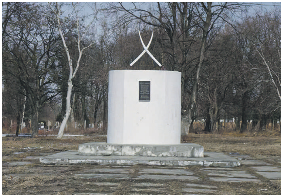
Emlékmű az 1703–1711-es Rákóczi-szabadságharc 91 falubéli kuruc katonájának

Árpád-kori, kismemesi vidék gócpontjának számító magyar lakta település, 1220-ban először Villa Petur , majd Peturfalva néven említik. A XIV. században a település vezető főúra: Péterfalvy család . A birtokosok között nevezik meg a Szirmay, Bencze, Székely, Illés, Balogh és más családokat.