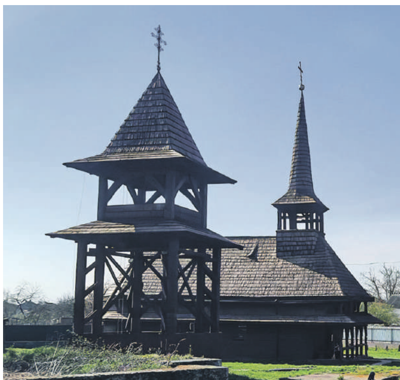
A tiszabökényi görögkatolikus templom felújítás után