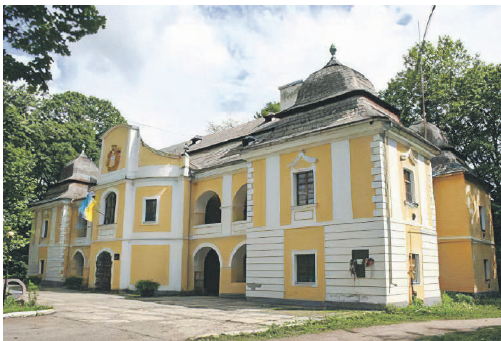
Perényi kastély (Nagyszőlős)