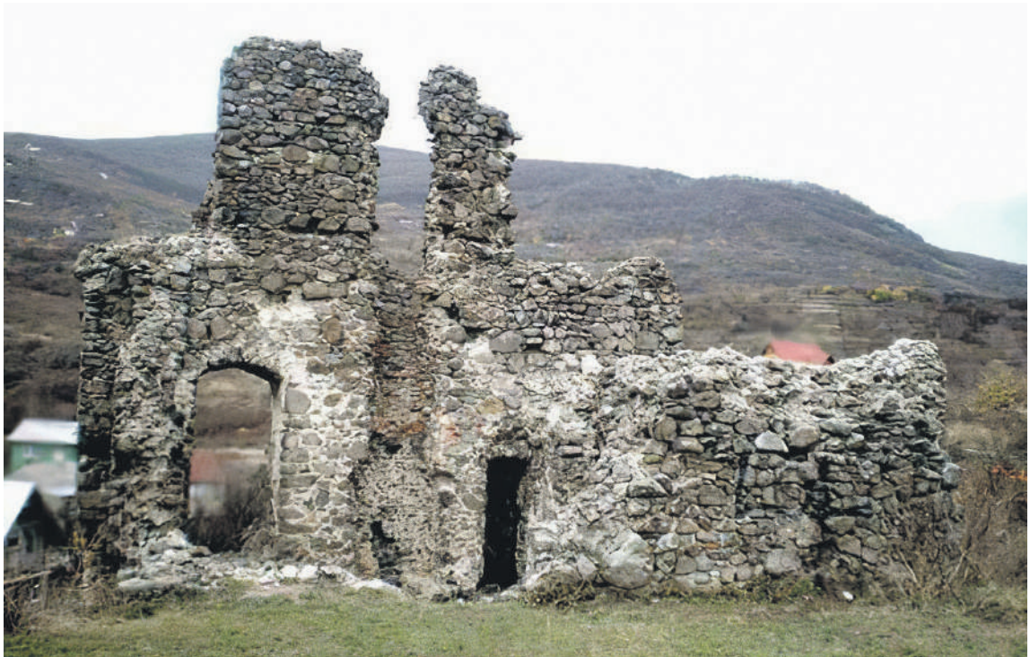
A nagyszőlősi Kankó-vár romjai