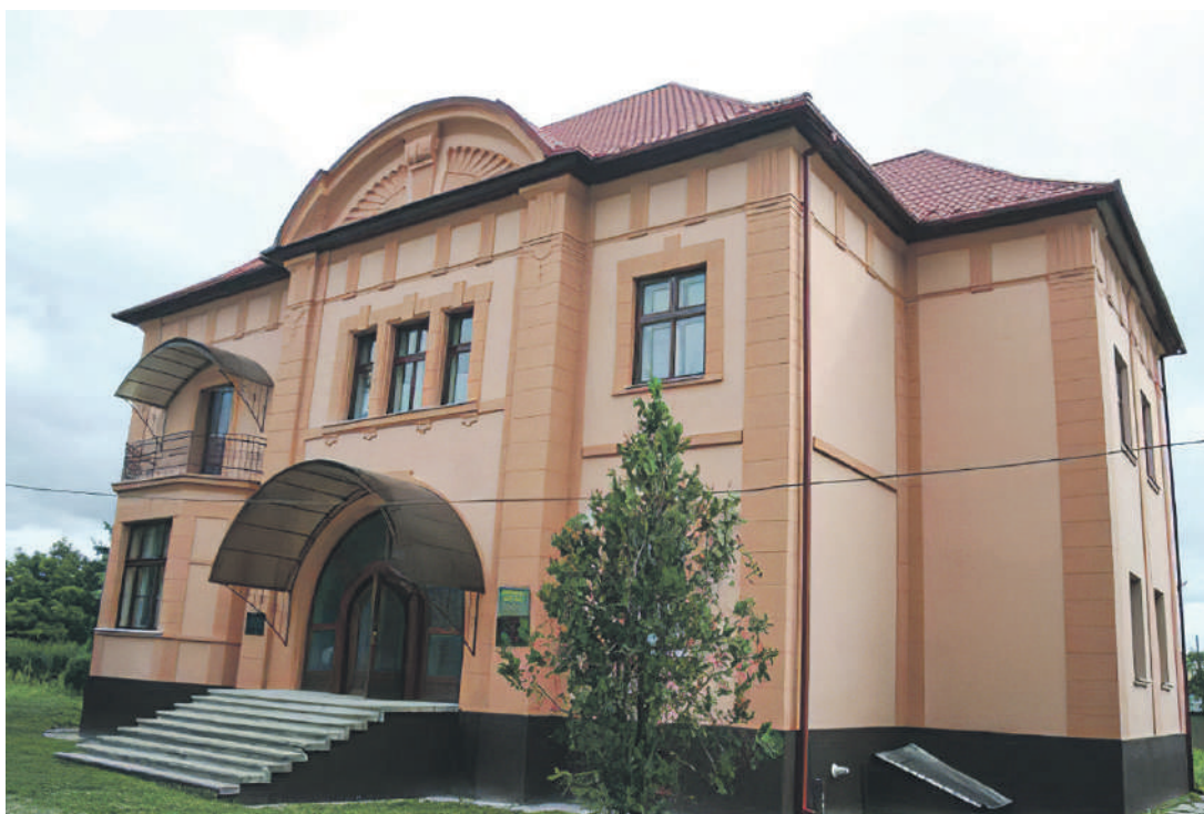
György-kastély. Péterfalvi Képtár

Fontosabb emlékhelyei: György-kastély . Tiszapéterfalva központjában található az 1870-es évek végén épült György-kastély. Nevét egykori tulajdonosáról, György Endre (1848-1927) földművelésügyi miniszterről kapta, aki nyárilaknak használta az épületet. A kastélyban 1986. augusztus 10-én Bíró Andor , a Határőr Kolhoz elnökének kezdeményezésére megnyílt a Péterfalvi Képtár, amely azóta is az épületben működik. A képtár kiállítási anyagát a kárpátaljai festőművészek közel 200 alkotása teszi ki. 2003-ban a kastély falára emléktáblát helyeztek György Endre tiszteletére.