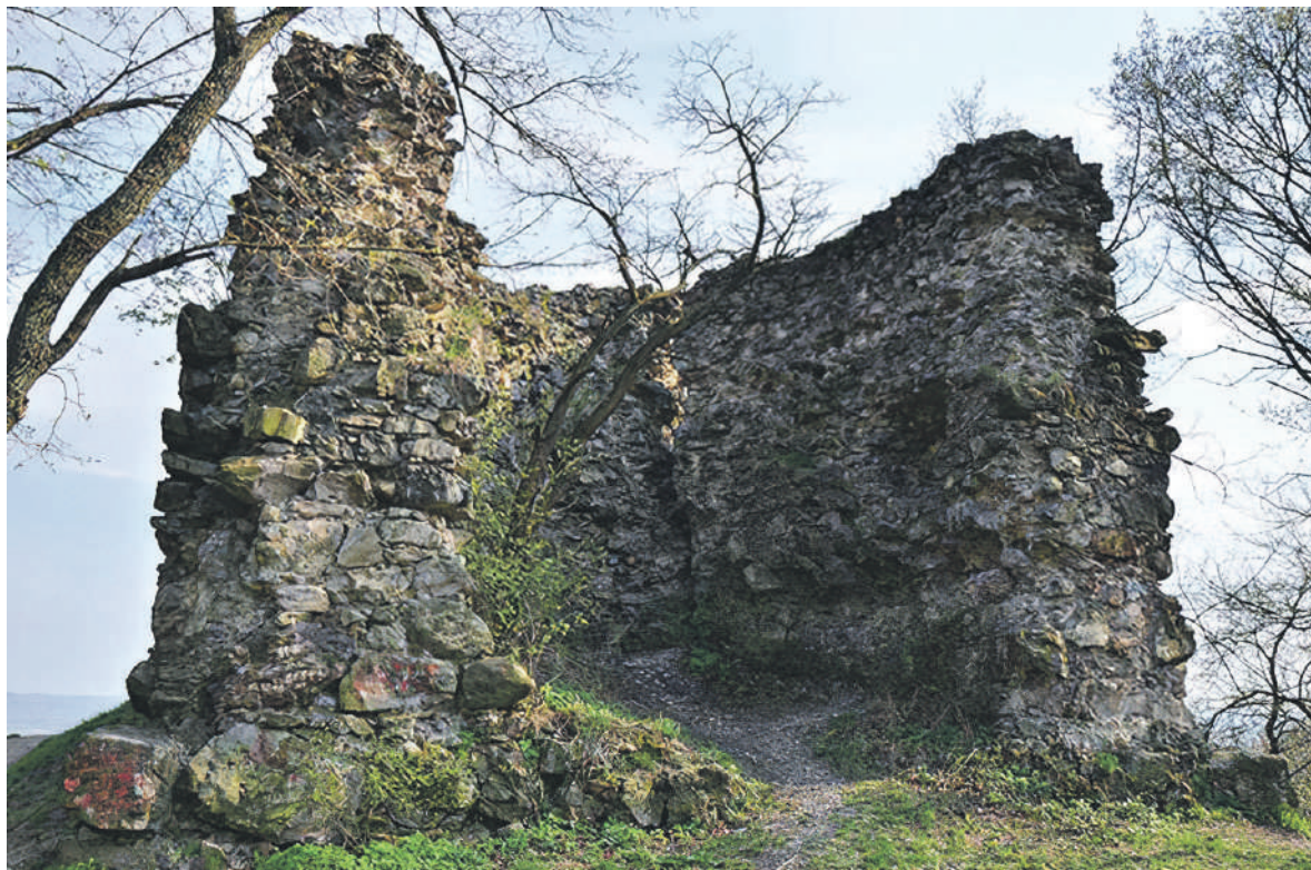
A királyházi Nyalábvár romjai