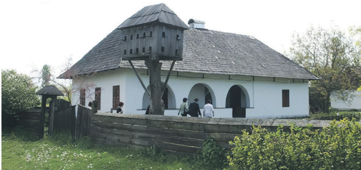
Háromosztatú lakóház a Tiszaháti Tájmuzeum területén

A falusi iskola a hozzá épült tanítólakkal 1920-ban épült Tivadarfalván. Az épület első részében az iskola kapott helyet, amelyben az első 6 osztály tanulói tanultak egyidejűleg. Az épület hátsó részében (szoba-konyha-tornác) a tanító lakott a családjával. Az ilyen stílusú épületek a XIX. század derekán jelennek meg falvainkban. Az épületet – szétbontás után – 1976-ban állították fel újra.