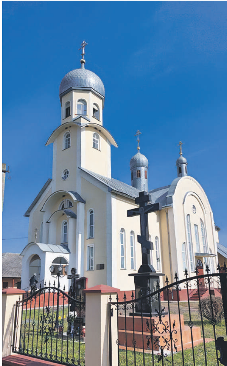
A tiszabökényi ortodox/pravoszláv templom