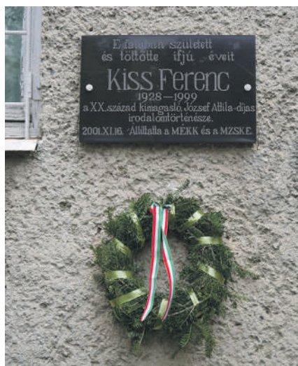
Kiss Ferenc irodalomtörténész emléktáblája a péterfalvai középiskola falán

A településen született: Komáromy András (1861–1931) történész, levéltáros, az MTA tagja; Kiss Ferenc (1928–1987) Magyarországon elhunyt irodalomtörténész, kritikus, az MTA Irodalomtörténeti Intézetének tudományos munkatársa. Tisztelői mindkét személyiségnek a helyi magyar középiskola falán emléktáblát helyeztek el.