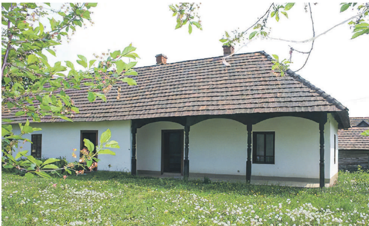
A falusi iskola a hozzá épült tanítólakkal a Tiszaháti Tájmuzeum területén