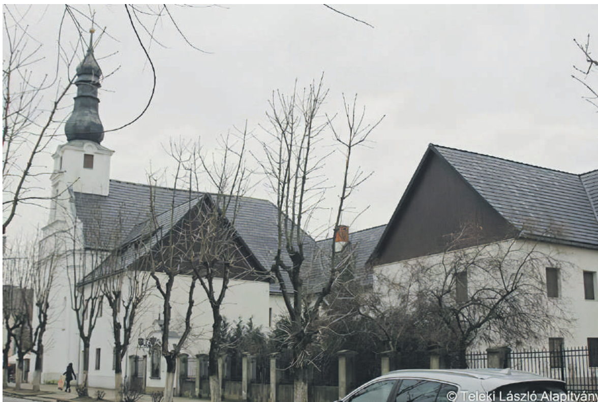
A nagyszőlősi ferences kolostor és templom

A ferencesek 1669-ben másodízben telepedtek meg a városban. Első kolostoruk a Kankó vár területén volt, amely a történelem viharaiiban kihalt, elpusztult. A Perényiek adománya nyomán, Bánffy Gábor egykori udvarházából átalakítások sorával jött létre a rendház mai formája. E rendház mellé építették meg észak-déli hossz tengellyel templomukat, amely később egy tűzvész áldozata lett.