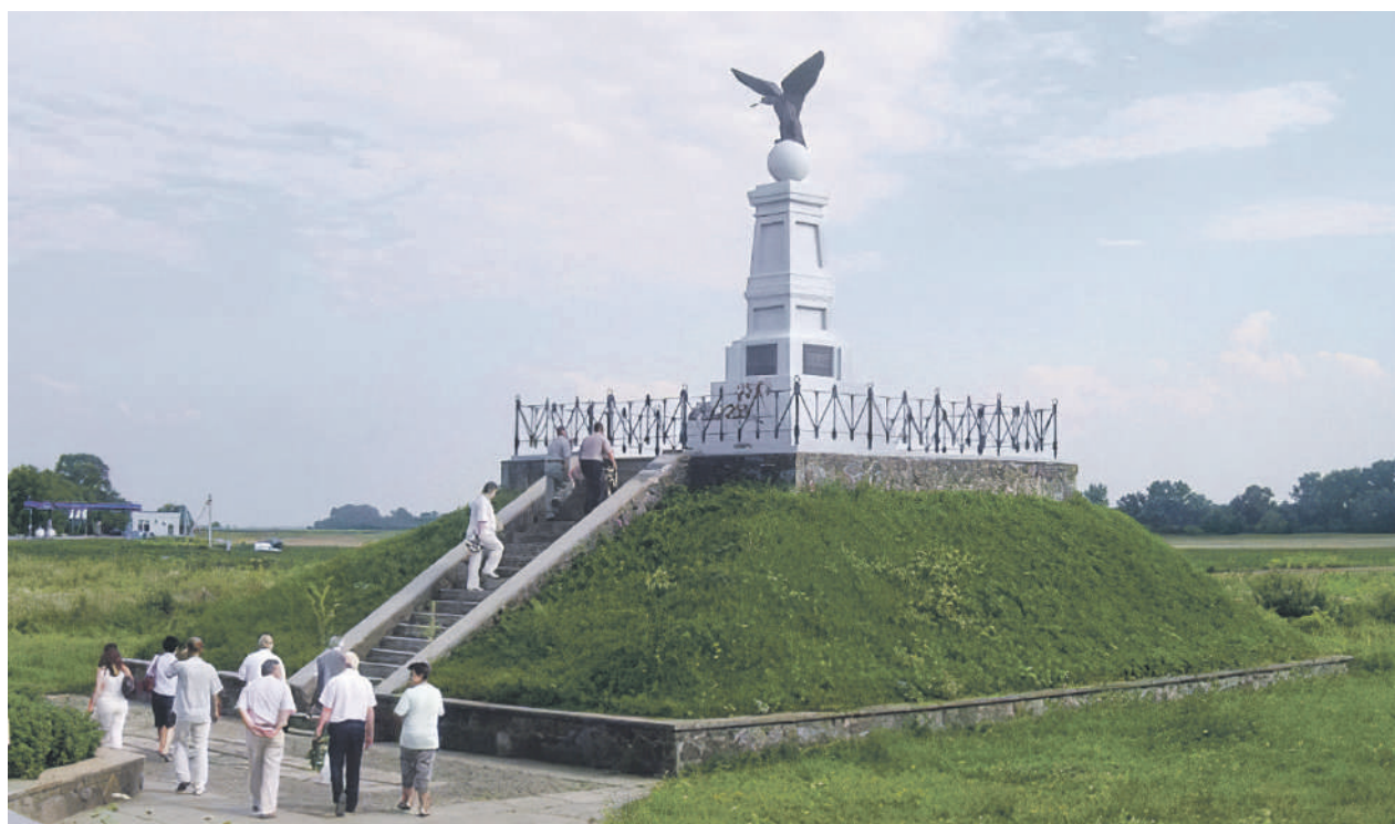
Az 1989-ben újraavatott Rákóczi turulmadaras emlékműve