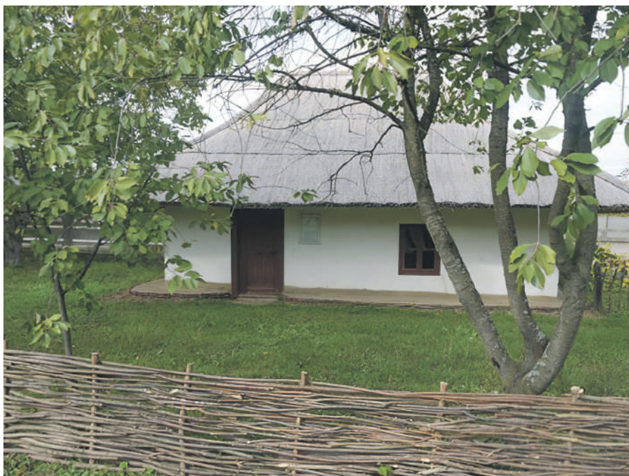
Egysejtű (egyszobás) lakóház a Tiszaháti Tájmuzeum területén

A Tiszaháti Tájmuzeum területén megtekinthető az ún. zsellérház (egyszobás), ami egy szegény ember háza volt. A ház anyagában és méreteiben is tükrözi gazdája életmódját. Mivel vidékünk nagy része áradásos területhez tartozott, ez a ház is ún. paticsfalú: tehát a vesszőből font sövényfalat sárral tapasztották be, amit az ár levonulása után újra lehetett tapasztani. A ház mestergerendás, egysejtű, nyitott ereszes (ún. kutyafekvős). Padlója döngölt, teteje náddal fedett. Vélhetően az 1918-ban épült házat szakszerű szétbontás után 1975-ben állították fel mai helyén.