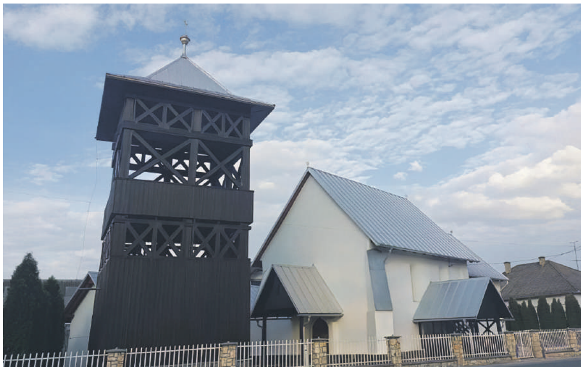
A tiszabökényi református templom

Bökény református egyháza 1554 és 1573 között keletkezett. Abban az időben a bökényi római katolikusok áttértek a református hitre, tovább használva ősi, XIII. századi templomukat. A középkori jellegét, eredeti románkori formáját megőrző, torony nélküli templomot az árvizek és pusztítások miatt többször átépítették, felújították. Mindössze a tetőzetét változtatták kisebb hajlásszögűre és a déli kapu elé fedett fatornácot építettek.