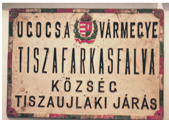
A község falutáblája a múzeummá átalakított Fogarassy-kastélyban