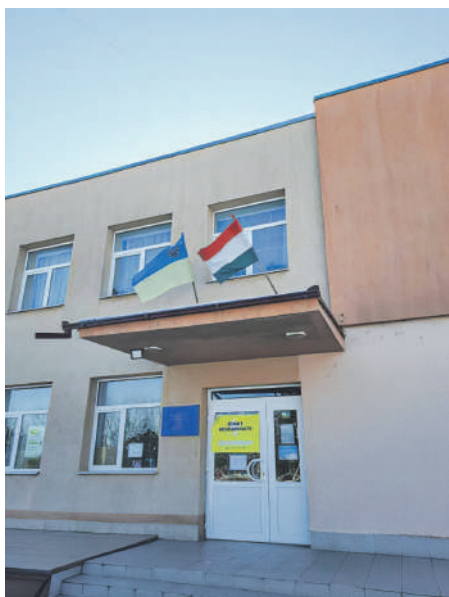
Tiszapéterfalvi Polgármesteri Hivatal