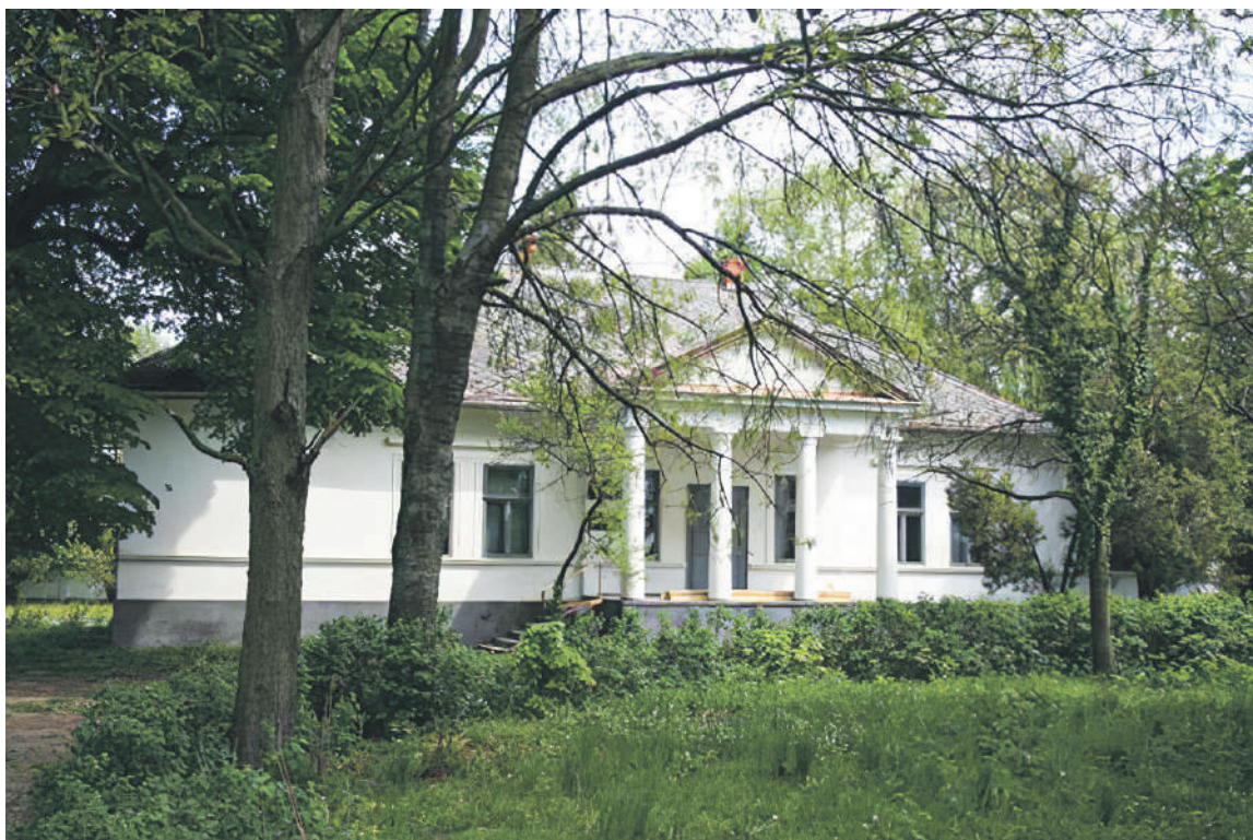
Fogarassy-kastély, ma Tiszaháti Tájmuzeum