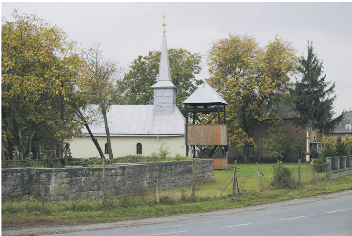
A tiszabökényi görögkatolikus templom felújítás előtt