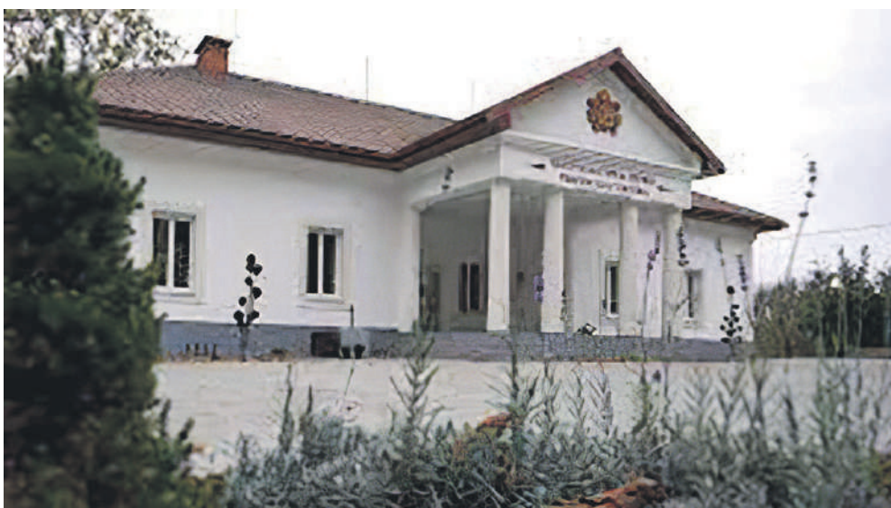
Perényi kastély (Beregdó).