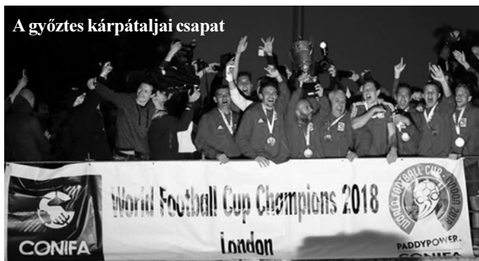
A győztes kárpátaljai csapat