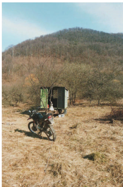
Bálint bácsi motorbiciklijé