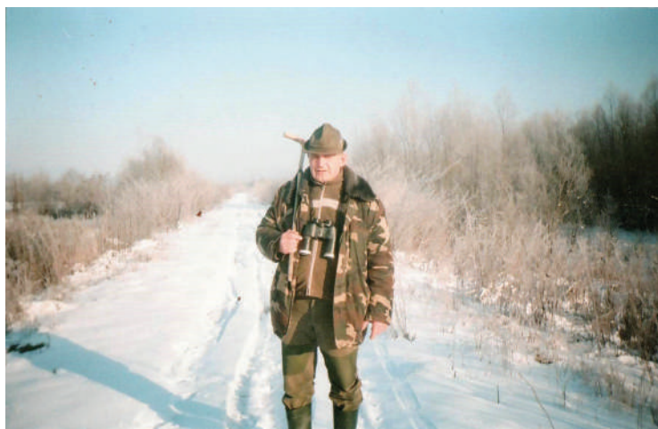
2013. március 17. Igen fagyos március volt

Megtapogattam a lámpámat, helyén volt. Bódultságom kezdett fölengedni, letettem puskámat, hogy elgémberedett lábaimat kissé megmozgassam, hogy a vér újra normálisan keringjen bennük. Ránéztem az órámra, negyed egy volt. Jót aludtam – gondoltam magamban. Éppen cigaretta után kutattam a zsebemben, mikor jobbra tőlem és a hátam mögött a gyümölcsös irányából ágrecsenést hallottam. Kézbe vettem a fegyveremet és a lámpát, s feszülten figyeltem. A zaj egyre erősödött. Arra gondoltam, hogy több disznó jön fölfelé a gyümölcsösből éjjeli portyájukról a biztosabb erdőbe. Megvártam, míg a zaj kiér az erdei útra, és akkor rákapcsoltam az elemlámpát. Míg a vad jött felfelé, én is féltérdre ereszkedtem, és bal kezemmel a csó alá szorítva a lámpát, rávilágítottam a vadra. Mondhatom, nagyon meglepődtem, mikor a vélt disznó helyett egy hatalmas medve körvonalait vettem észre.