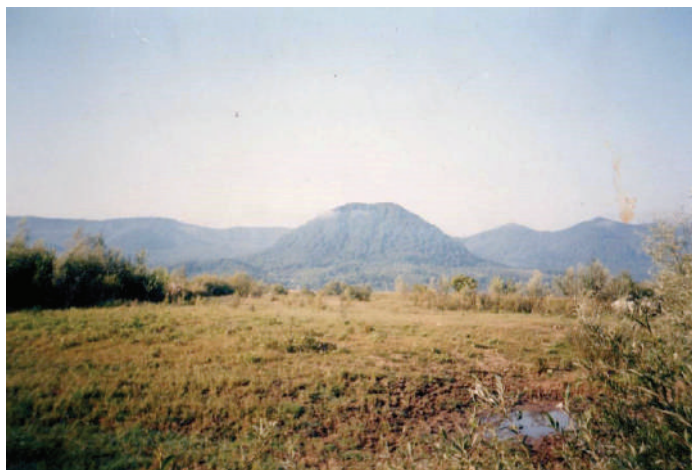
A Várhegy (Visk-várhegy)északkeleti oldala a Tisza partjáról fényképezve

Elég sokat jártam utána, végül is sikerült elkapnom. 2015. május 1-én már befizettük a kilövési engedélyeket őzakra, de még nem kaptuk kézhez. Ez nálunk ugyanis hosszabb huzavona. Úgy történik, hogy egy vagy több engedélyt adnak ki, brigádokra, tíz-tizenöt emberre. Mikor megkapjuk az engedélyeket, úgy osztjuk be, hogy akinek ideje van szombaton, vasárnap, vagy éppen nem dolgozik valahol külföldön, akkor az illető jelzi az illetékes személyeknek, hogy mikor és melyik területre kíván menni, lehetőség szerint a hozzá tartozó brigádba.