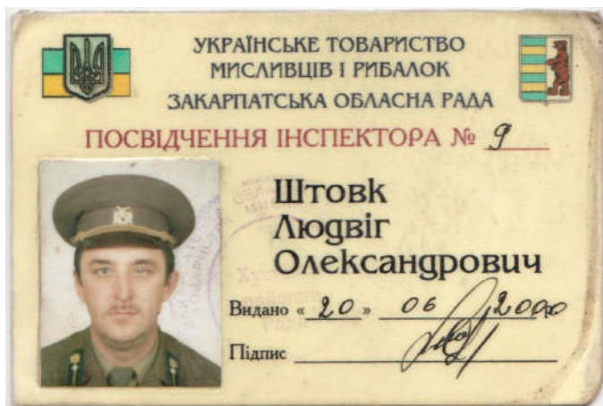
A szerző vadőri igazolványa Kárpátalja címerével, a medvével a jobb felső sarokban