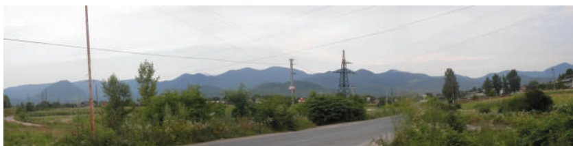
A viski határt karéjozó Avas-hegyvonulat