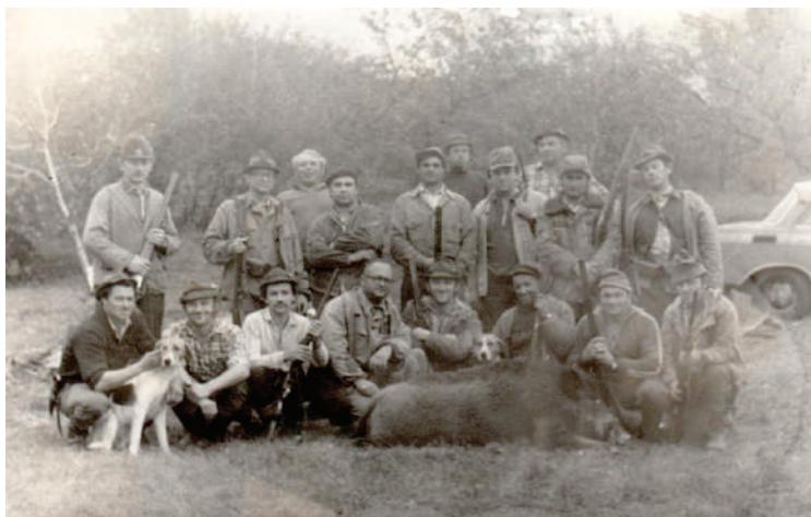
Egy emlékezetes vaddisznóvadászat

az idő, a hegy meg igen meredek volt. Odaértem a kitervelt helyemhez, egy a fák között keresztbedőlt tölgyfát néztem ki ülőhelyemnek. Ráraktam hátzszakomat, majd kényelmesen elhelyezkedtem rajta. Még igen korai volt az idő, a fák körvonalait tudtam csak megkülönböztetni. A puskámat mindig a térdemen helyezem el úgy, hogy a markolat minden esetben a jobb kezemhez essen, míg a csövet bal kézzel fogjam. Közben egyre jobban világosodott, már bármilyen vadat meg tudtam volna különböztetni. Jobbra nézve, amelyik irányból érkeztem, elállt a lélegzetem, a nyomomon keresztben állva egy hatalmas gesztenyebarna disznó állt, mereven, akár egy szobor. Azt hittem, álmodom. Csöndben megfogtam a puskámat, előre toltam a biztosítót, és mivel bal vállról nem tudok lőni, szép lassan áttettem a puskát a jobb kezembe. Hiába volt hűvös a reggel, izzadni kezdtem. Már a jobb kezemben volt a puska, de nem tudtam, hogy emeljem vállhoz, és a vaddisznó kezdett fülelni, valami nagyon nem tetszett neki. Úgy döntöttem, hogy hirtelen fordulással fogok lőni, lesz, ami lesz. Így is történt.