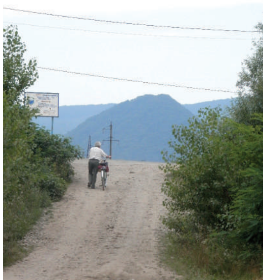
A Várhegy a Tisza-partról

emeltem a fegyvert, és amikor a vállamon volt, lassan jobbra fordultam. Megcéloztam a lapockáját, mert keresztben állt, és lőttem. A bak két hátsó lábára emelkedett, nagyot ugrott előre. Nem futott, csak lépésben indult el, csak néhány lépést tett, és újra megállt. Rajta tartva fegyverem a balcsőből is tüzet nyitottam. Összeesett. Nem hittem a szememnek. Álmodom, vagy ez a valóság? Odamentem hozzá, s levettem a kalapomat. Le is vehettem, egy ilyen bak előtt ez a minimum, hogy a vadász leveszi kalapját, megadja a tiszteletet a vadnak. Ilyen egyszerű? Hány hajnalt, hány estét jártam utána, és még csak nem is láttam, csak hallottam.