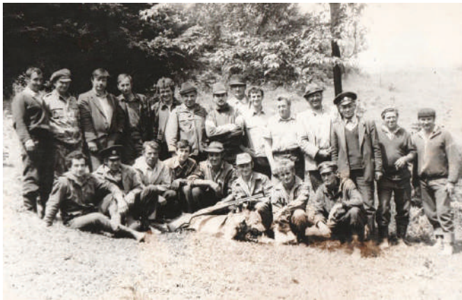
Farkasvadászat, 1989. június 2. Visk, Polján terület

Mivel 1982 novemberének elején engem választottak meg a Viski Vadászegyesület alelnökévé, szabad mozgásom volt vadászterületünk minden részén. Alapjában véve az alelnök töltötte be a vadászmesteri posztot, akinek szerveznie kellett a vadászatokat, a dúvadírtást, az etetők karbantartását, és háromhavonta jelentést kellett írnia mindezekről.