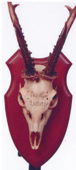
A várhegyi bak