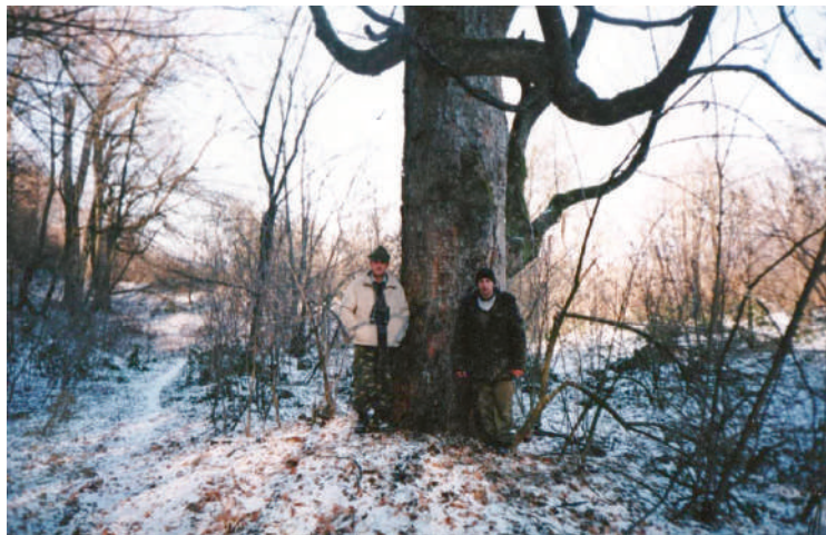
A nagy juharfa télen (bal oldalon a szerző)

Lassan kezdtem összeszedni gondolataimat, és szerencsére pillanatok alatt minden beugrott, már tudtam, hol vagyok és miért.