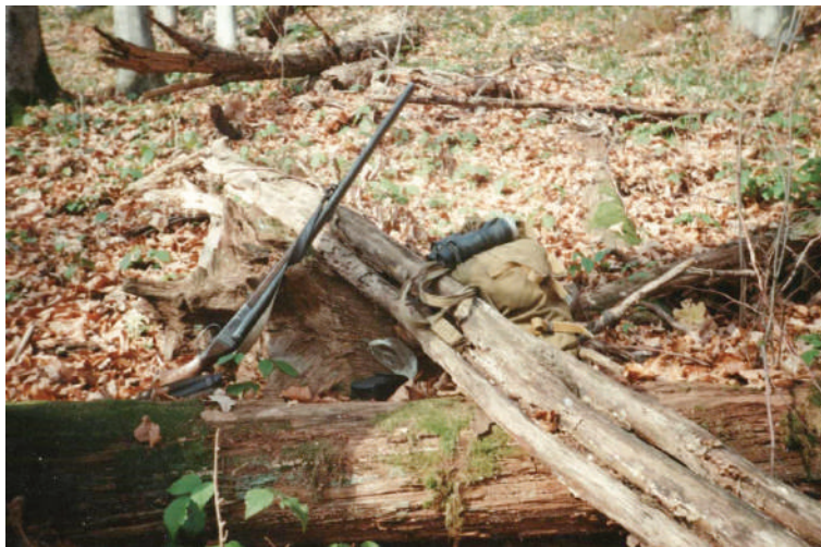
Hűséges társaim: az öreg tizenkettes, a gukkerom és a hátizsák

hogy neked is kellesz, ezért itt van neked is egy szál” – s a konyhasztalon álló vázára mutatott, melybe egy egész csokor tubarózsa volt helyezve. Megörültem a virágnak, melyből egyet leszakítottam, és beillesztettem a kalpom szalagja mögé.