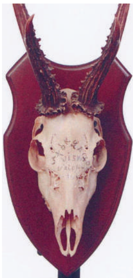
A sajáni bak Ez volt az első bakom. Véletlenül elejtették, s letört az orra

szakítottak meg. Egy mély völgybe értem, ahol egy igen jó vizű forrás volt. A forrástól néhány méterre készítettem leshelyet magamnak. Vadásztam már a környéken, ismertem a körülményeket és a vad mozgását is. Azt is tudtam, hogy az augusztusi forráságban a forrás igen csalogató a vad számára, erről a vadnyomok is tanúskodtak. Kényelmesen elhelyezkedtem leshelyemen, rágyújtottam, s csak jóval azután próbálkoztam a hívással. Sokáig nem történt semmi. A nyári nap lassan hanyatlott a hegytetők fölött. Még mindig erősen meleg volt, egy szál ingben üldögéltem, és kísérleteztem a hívással. Kis idő múltán zajt hallottam a szemközti domboldalon, újra megnyomkodtam a buttolót. Kétszeri próbálkozás után riasztást hallottam, komoly hang volt, nem is olyan távol tőlem. Azonnal felkészültem a lövésre, hiszen nem volt kétséges, hogy felém tart.