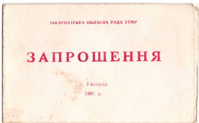
Az 1991. évi vadászkonferencia meghívója és a mandátum