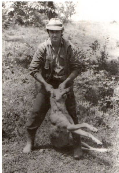
Farkasvadászat, 1989. június 2. Visk, Polján terület. Az elejtett vad 37 kg volt