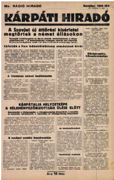
Kárpáti Híradó, 1944. március (21. évfolyam, 52. szám)

Úgy tűnik, az általános öröm közepette kevesen éreztek rá arra az szomorú tényre, hogy az emberiség 1939-ben már egy új világegés küszöbén állott, s ez a világegés majd nálunk, Kárpátalján, s egész Magyarországon is üszkös romokat és be nem gyógyuló sebeket fog maga után hagyni.