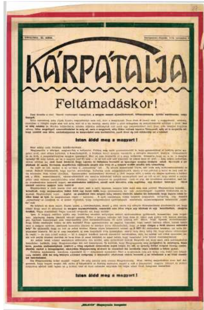
Forrás: Kárpátalja, 1938 (6. évfolyam, 32. szám)

A forrongó világ eseményei közepette hitvallásként fogalmazódott meg a lap szerkesztőinek egyik alap gondolata „Kultúra csak egyféle van ezen a világon. A különböző nemzeti kultúrák is csak ennek az egyetlenegy, egyetemes emberi kultúrának a szolgálatában állnak... És ha már a pusztulás elé megy a világ, mert a különböző nemzetek nem értik meg egymást, mennyire inkább pusztulásra vagyunk ítélve mi, itt élő magyarok, ha nem a megértés jegyében dolgozunk? Ha különböző nyelvet beszélő nemzetek elfordulnak egymástól, baj, de lehet találni magyarázatot. De mikor azok szóródnak önkéntes elvakultságban széjjel, akiket még a nyelvi közösség és ezer év minden emléke is egymásra utal, mikor színeket keresnek ott, ahol csak értéket szabad találni, erre nincs magyarázat, nincs mentség.” 98