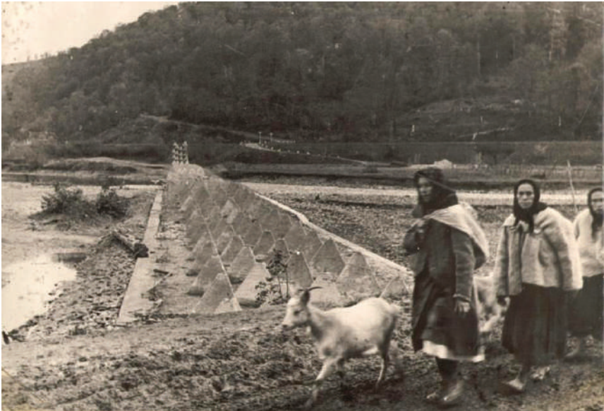
1. Archive photo. Part of the Árpád Line relinquished without action (end of October, 1944)

1. ábra. Archiv felvétel. A harc nélkül feladott Árpád-vonal egy része a Kárpátokban (1944. október végén.)