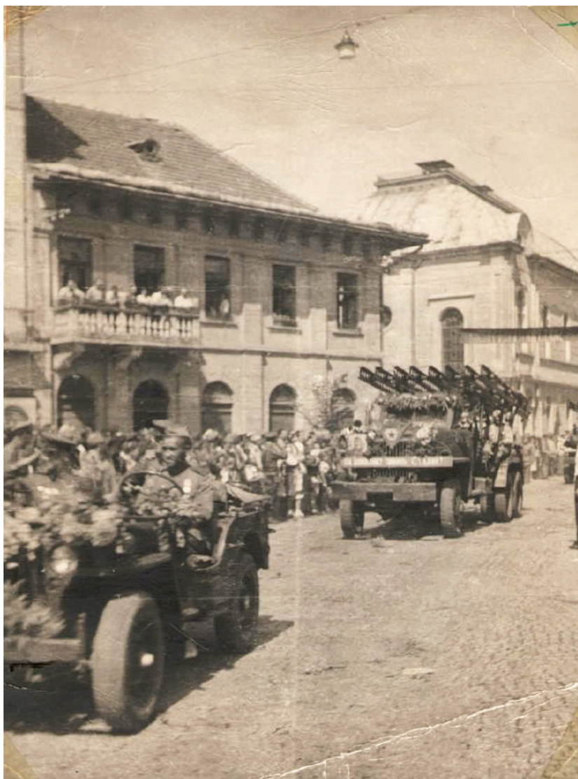
2. Archive photo. The entry of the Soviet units into Munkács (October, 26, 1944)