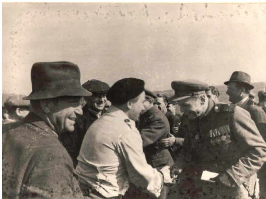
3. Archive photo. The reception committee of Munkács welcomes high ranking Soviet officers arriving at Munkács (October, 26, 1944)