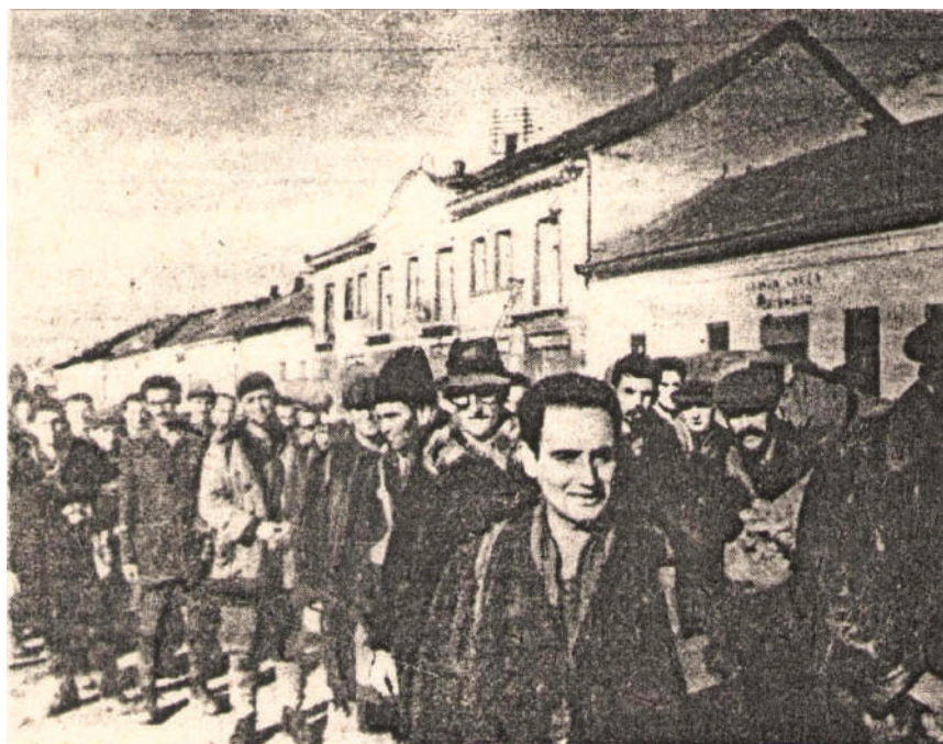
8. Archive photo. The march of the people applying for “a three day’s work”, “malenky robot” towards the collecting camp of Szolyva (Uzhgorod, Munkácsi street, November, 18-20, 1944)